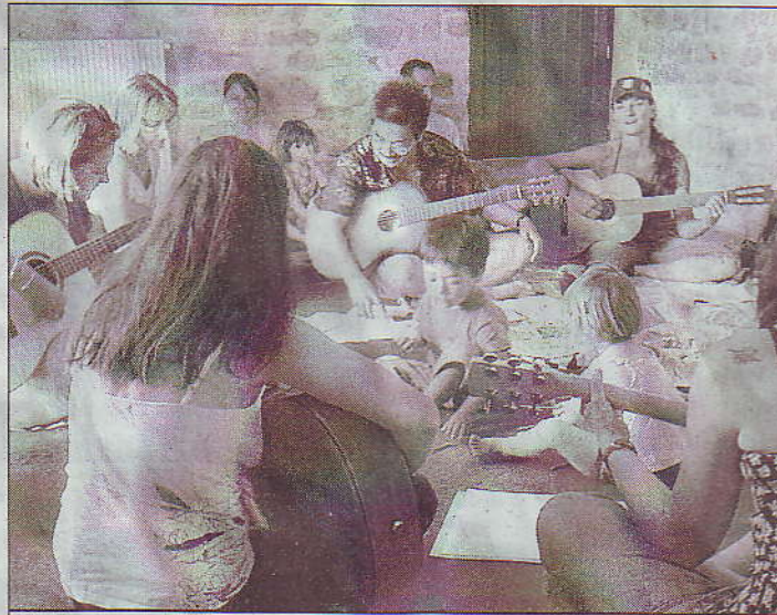
Des ateliers qui associent parents et enfants, tout un programme.

rents : l'un où l'on accompagne les comptines à la guitare, l'autre qui consiste à préparer l'arrivée de bébé, créer un lien avec lui, mieux vivre sa grossesse et préparer son accouchement.